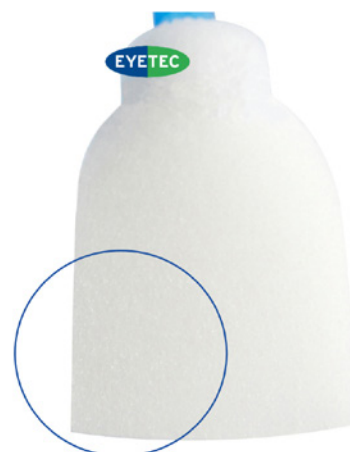
EYETEC® PVA Saugtupfer