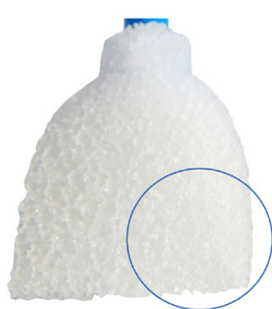
Standard PVA Saugtupfer